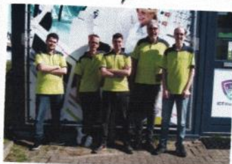
Het team van RoBoWeb staat voor u klaar!