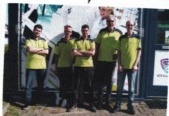
Het team van RoBoWeb staat voor u klaar!